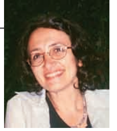
Hazırlayan: Doç.Dr. Serpil Çakır İstanbul Üniversitesi Siyasal Bilgiler Fak.